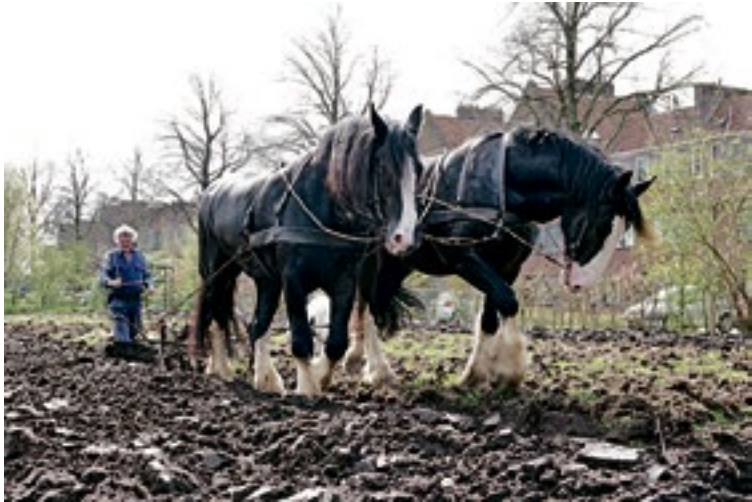
Twee sterke Shire paarden trekken de handploeg.