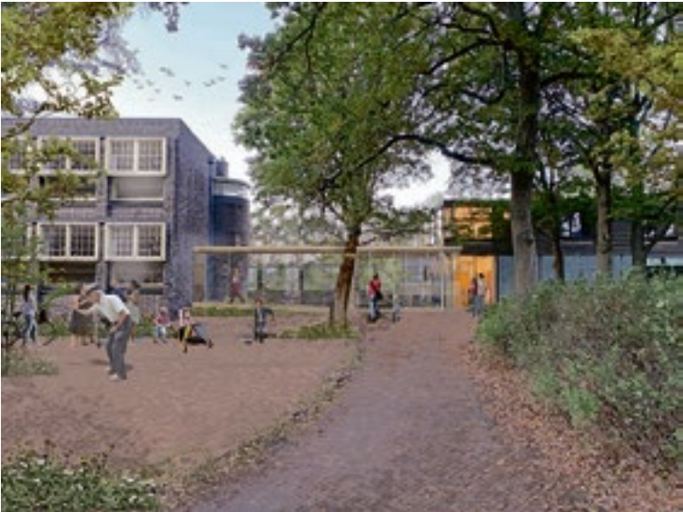
Toekomstige entree bij Van Houten (De Unie Architecten).

Ook alvast het vermelden waard: de manifestatie ‘Ontdek bij Van Houten’, op zaterdag 6 juli van 12 tot 16 uur.