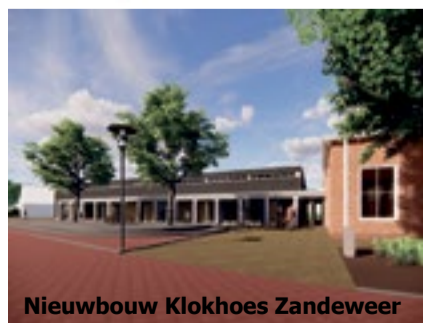
Nieuwbouw Klokhoe Zandeweer

Bovenhuizen 52-54 9981 HB Uithuizen 0595 - 43 38 83